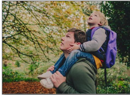
Jan 16, 2018 Packaging & Recycling