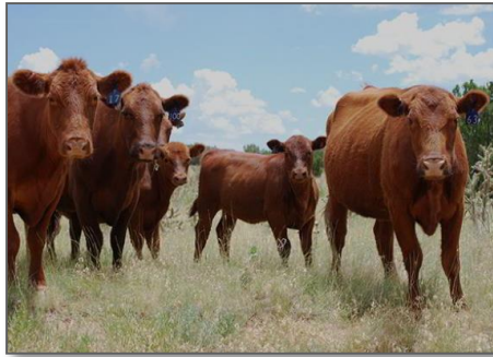
Feb 2017 Beef Sustainability