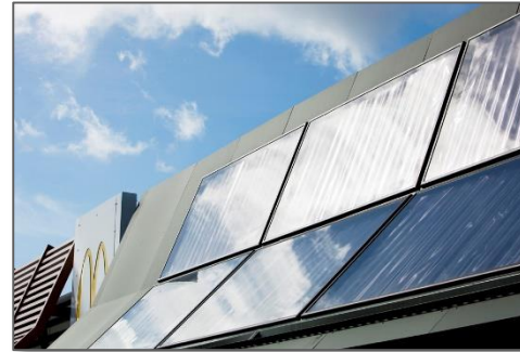
Mar 20, 2018 Climate Change